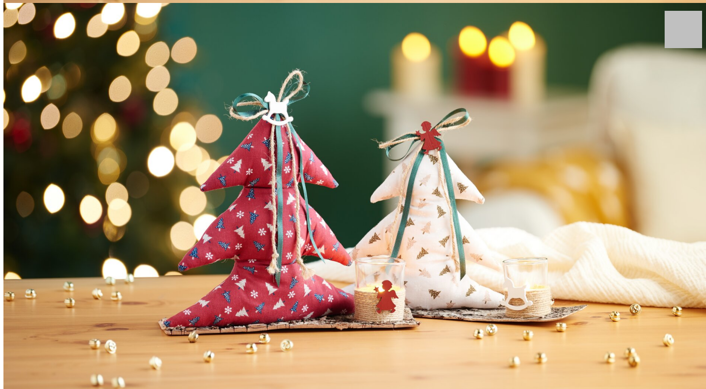
Schritt 9: Dekorieren des Tannenbaums

Nun kommt der spaßige Teil: die Dekoration! Binde eine hübsche Schleife aus Satin- oder Juteband und befestige sie an der Spitze deines Tannenbaums. Du kannst die Schleife entweder annähen oder mit Heißkleber festkleben. Ergänze die Schleife mit passendem Streumaterial, um deinem Tannenbaum noch mehr Charme zu verleihen. Lass deiner Kreativität freien Lauf