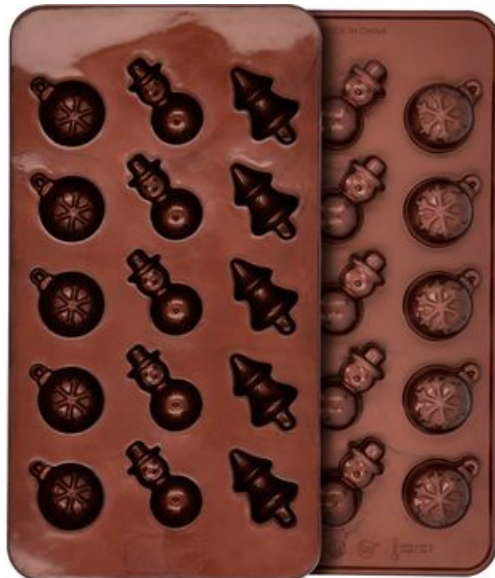
Silicone praline moulds "Christmas"