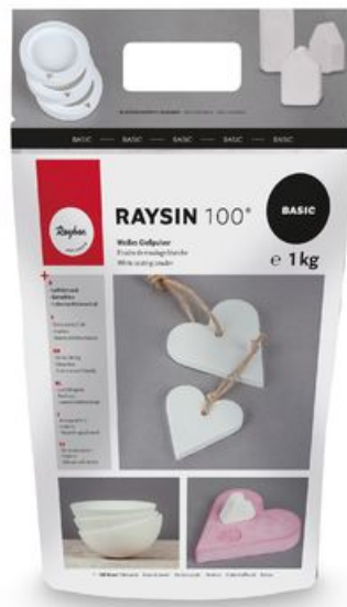
Gießpulver "Raysin 100", weiß, 1 kg